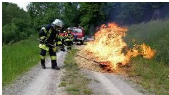
Bilder: 5 (vorherige Seite 10), 6, 7: Tätigkeiten bei Einsätzen im natürlichen Raum

Dazu kommen die oft sehr zeitintensiven Einsätze bei Unwetterlagen. Für einige der beispielhaft genannten Einsatz Tätigkeiten gelten besondere Sicherheitsvorschriften (zum Beispiel besondere Schutzausrüstung beim Arbeiten mit einer Motorkettensäge).