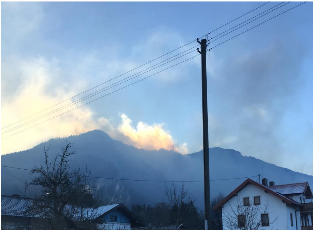
Bild 1: Waldbrand am Jochberg am 1. Januar 2017: Auf den Hausdächern Schnee, hinten oben die Rauchschwaden des Waldbrandes

Brände im natürlichen Raum haben ihre Saison, können aber auch immer dann passieren, wenn es trocken ist. Der Brand am Jochberg am 1. Januar 2017, der sich auf eine Fläche von mehr als 100 Hektar ausdehnte, war dafür ein besonderes Beispiel. Also ist die Jahreszeit nur von untergeordneter Bedeutung, auch wenn Schnee und Eis im Winter das Erreichen der eigentlichen Einsatzstelle nochmals deutlich erschweren können.