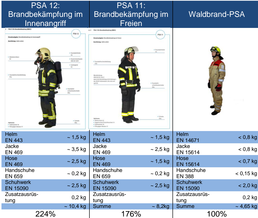
Tabelle 2: Gegenüberstellung der PSA-Ausführungen

Je nach der vor Ort vorhandenen Ausführung können sowohl PSA 12 als auch PSA 11 noch einmal deutlich schwerer sein. In den bisherigen Betrachtungen zeigte sich stets, dass eine möglichst leichte PSA von großem Vorteil ist.