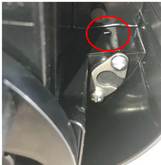
Bild 2. Formfehler (Loch) im explosionsgeschützten Handscheinwerfer der Serie SEB. Das Loch kann unterschiedlich groß sein.