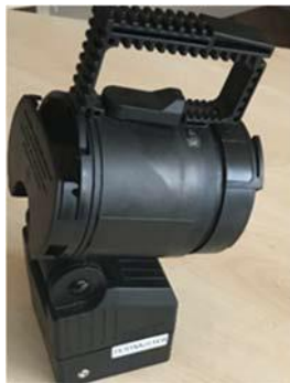
Bild 1. Foto eines explosionsgeschützten Handscheinwerfers der Serie SEB

Aus unseren Aufzeichnungen geht hervor, dass Sie zwischen Juli 2015 und Juli 2020 explosionsgeschützte Handscheinwerfer der SEB Serie 8 und 9, bzw. zwischen April 2016 und Juli 2020 explosionsgeschützte Handscheinwerfer der SEB Serie 10 bei uns erworben haben. Der Hersteller hat das potenzielle Vorhandensein eines Lochs in der Wand des Leuchtenkopfes (Abbildung 2) festgestellt. Bitte entnehmen Sie dem Anhang C, wie Sie den Herstellungszeitraum Ihres Produkts ermitteln und feststellen können, ob Ihr Produkt möglicherweise betroffen sein könnte.