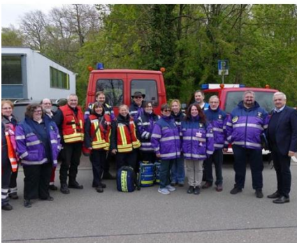
Gut gelaunte Übungsteilnehmerinnen und -teilnehmer der PSNV Neckar-Odenwal